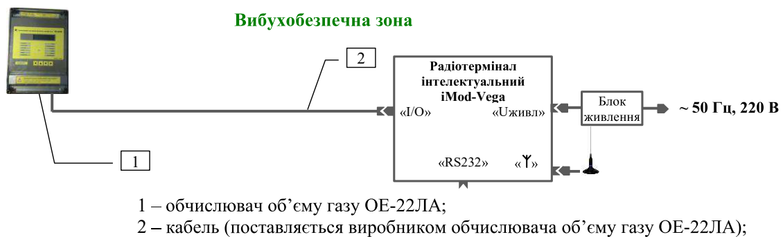
Рисунок 3 – Схема підключення радіотерміналу до обчислювача об'ємної витрати і об'єму газу ОЕ-22ЛА

УВАГА! КАБЕЛЬ КПОЕ ПОВИНЕН БУТИ ІЗОЛЬОВАНИЙ ВІД ІНШИХ ЕЛЕКТРИЧНИХ ПРОВОДІВ, ЯКІ МОЖУТЬ ВИКЛИКАТИ ЕЛЕКТРИЧНІ ПЕРЕШКОДИ, ТА, ПО МОЖЛИВОСТІ, ПОВИНЕН БУТИ ПРОКЛАДЕНИЙ В ІЗОЛЯЦІЙНІЙ ТРУБІ ЯК НАЙБЛИЖЧЕ ДО ПОВЕРХНІ ҐРУНТУ.