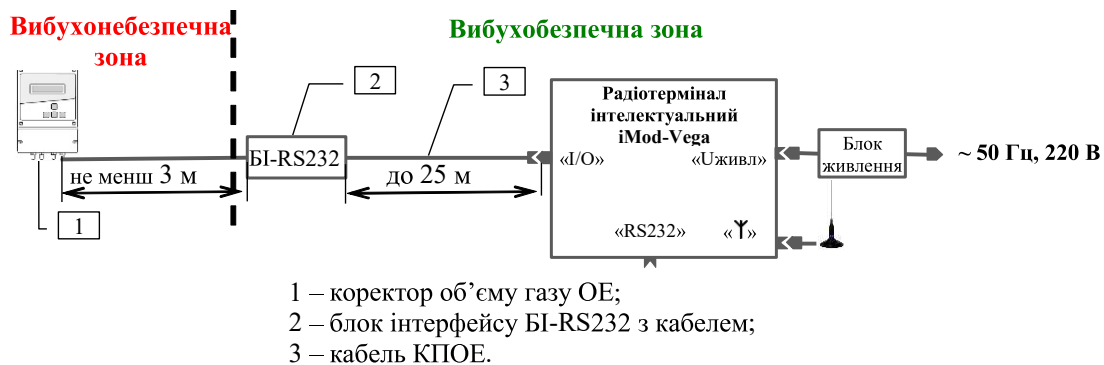
Рисунок 2 – Схема підключення радіотерміналу до коректора об'єму газу ОЕ

Схема підключення радіотерміналу наведена на рисунках 2, 3.